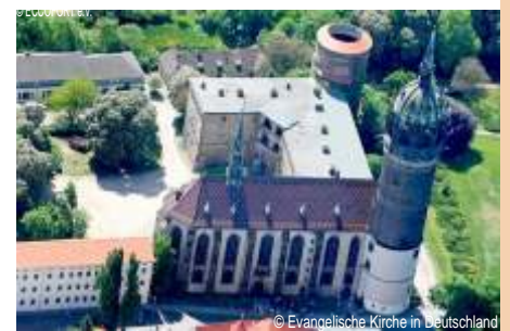
Befestigte Schlosskirche, Lutherstadt Wittenberg