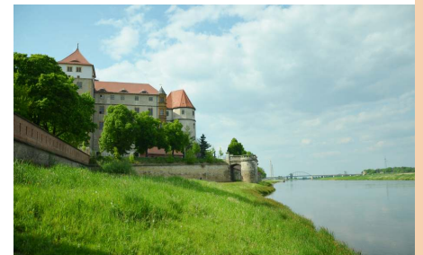
Außenanlagen der Festung Torgau am Elberadweg

Lutherstadt Wittenberg Befestigte Schlosskirche, Ehemals befestigte Stadt