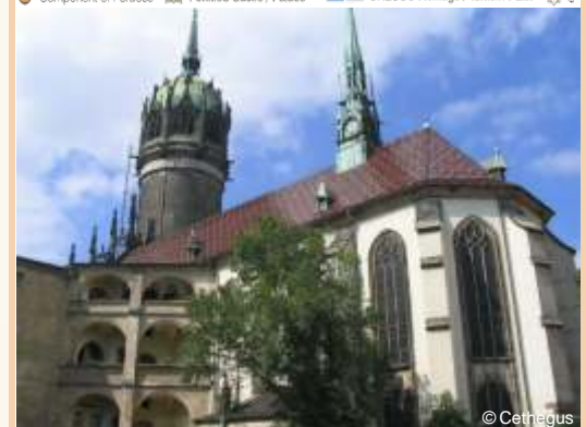
Befestigte Schlosskirche Lutherstadt Wittenberg

Entdecken Sie die Elbefestungen, voller Leben, Kultur, Unterhaltung und interessanter Geschichten!