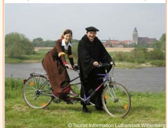
Geführte Fahrradtour „Luthers Land heute“, Lutherstadt Wittenberg