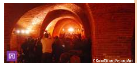
Buntes Abendprogramm Kulturfestung Mark