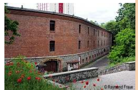
Kaserne und Kulturfestung Mark, Magdeburg

www.festungmark.com www.magdeburg-tourist.de