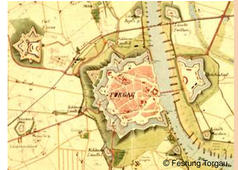
Hauptwerk und Brückenkopf der preußischen Festung Torgau, Plan von 1888.