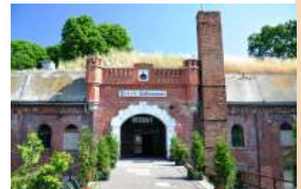
Fort IV, Großfestungssystem Torun