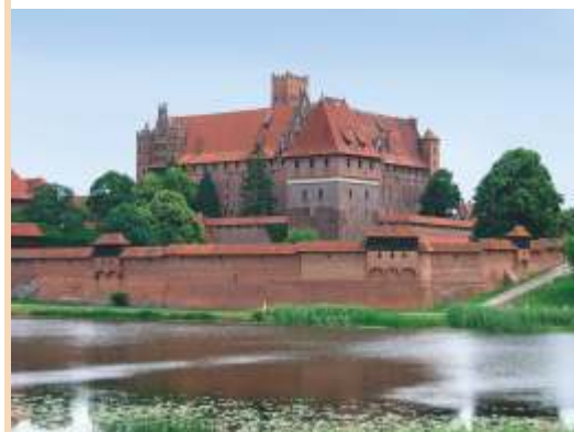
Mittelalterliche Festung Marienburg (Malbork)

Vorliegende Reiseempfehlung ist unverbindlich und ohne Gewähr für die Inhalte.