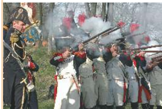
Historische Schlacht in der Festung Danzig