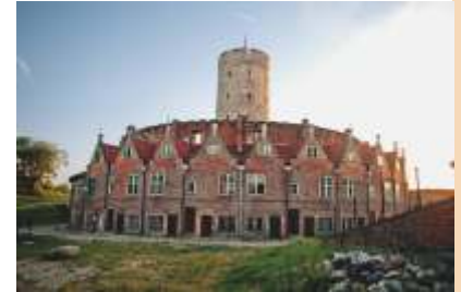
Offiziershäuser der Festung „Weichselmünde“