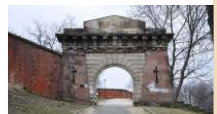
Tor Zitadelle Warschau