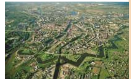
Danzig, Befestigte Stadt