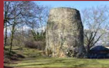
Cenotafio Romano de Druso (9 a.C.)

De 1870 a 1918 se construyó la fortaleza imperio de Maguncia con otro anillo de fortificación que constaba de más de 300 búnkeres y posiciones de defensa, incluyendo una vía férrea para su abastecimiento. La Ciudadela fue utilizada como campo de prisioneros de guerra. El Tratado de Versalles significó el final de Maguncia como ciudad fortificada y las fortificaciones se extraen ampliamente. En la Segunda Guerra Mundial se instaló de nuevo un campo de prisioneros de guerra en la Ciudadela, y las fortificaciones subterráneas se utilizaron como refugios antiaéreos. Entre 1945 y 1955, las fuerzas de ocupación francesas se instalaron en la Ciudadela y destruyeron edificios que habían sido parcialmente restaurados.