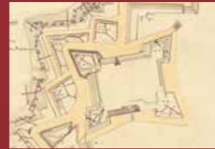
Secciones plan de las fortificaciones de la Confederación Alemana (1814-1866)