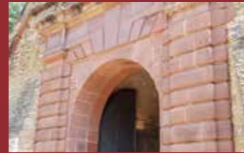
Puerta más antigua de la Ciudadela (1629)