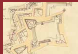
Extraits plan de la forteresse de la Confédération Germanique (1814-1866)