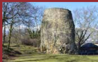
Cénotaphe de Drusus (9e siècle av. J.C.)

De 1870 à 1918, la forteresse impériale Mayence fut créée, avec un anneau de fortifications comprenant plus de 300 bunkers et postes de défense, et même une ligne de chemin de fer pour l'approvisionnement. La citadelle fut utilisée comme camp de prisonniers de guerre. Le traité de Versailles scella finalement la fin de Mayence en tant que ville fortifiée et de grands travaux de démantèlement débutèrent. Pendant la seconde guerre mondiale, un camp de prisonniers fut de nouveau mis en place dans la citadelle et les passages souterrains servirent d'abris anti-aériens. De 1945 à 1955, la puissance occupante française emménagea dans la citadelle et fit en partie reconstruire les bâtiments détruits.