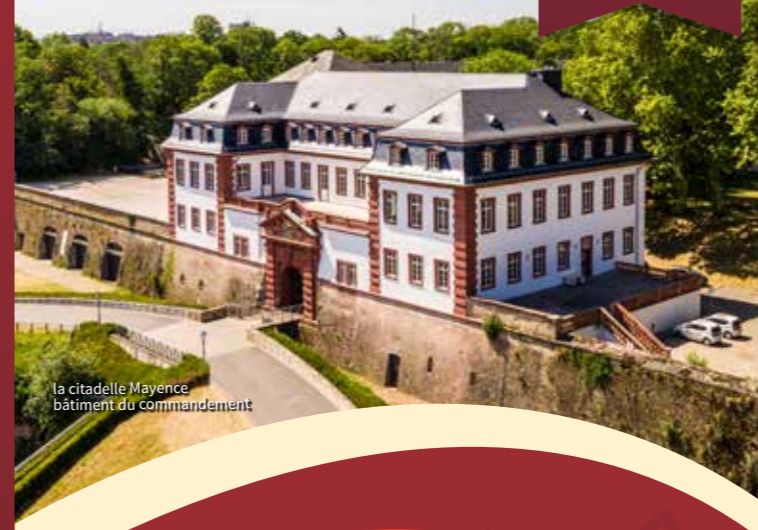
la citadelle Mayence bâtiment du commandement