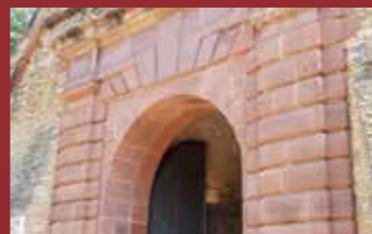
Porte la plus ancienne de la citadelle (1629)